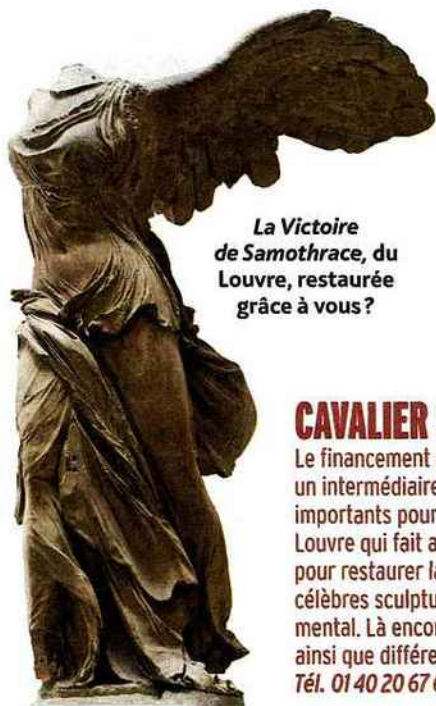
La Victoire de Samothrace, du Louvre, restaurée grâce à vous?